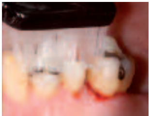
Blutet das Zahnfleisch beim Zähneputzen, ist dies das sichere Zeichen einer schwelenden Entzündung. Bei Zahnfleischbluten handelt es sich nicht um eine Verletzung, etwa mit der Zahnbürste, sondern um eine Reizung von entzündetem Gewebe.

Wird die Zahnfleischentzündung (Gingivitis) nicht behandelt, so kann diese auf das gesamte Zahngewebe übergreifen. Es entstehen Zahnfleischtaschen, die mit Bakterien gefüllt sind, und es kommt zu Knochenabbau (Parodontitis). Dieser Vorgang verläuft in der Regel sehr langsam, oft über Jahre hinweg, und ist meist nicht schmerzhaft. Der weitere Krankheitsverlauf führt zu einer erhöhten Zahnbeweglichkeit und zu Zahnwanderung. Ist das Zahngewebe schliesslich zerstört, findet der Zahn keinen Halt mehr und fällt aus.