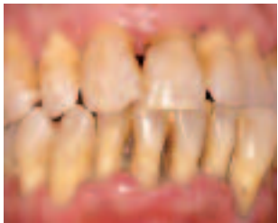
Ohne Behandlung kann im Laufe von wenigen Jahren aus der leichten Parodontitis dieses schwere Krankheitsbild entstehen: Eitrige, schmerzhafte Abszesse, gelockerte und gewanderte Zähne (Lückenbildung).

Wenn das Zahnfleisch beim Zähneputzen blutet, ist dies ein ernst zu nehmendes Zeichen einer entzündlichen Zahnfleisch-erkrankung. Hauptursache der Parodontitis ist der bakterielle Zahnbelag (Plaque), der auf der Zahnoberfläche haftet.